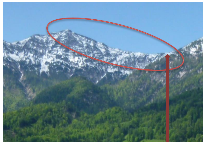
Blick zum Kalmberg, da fahren, gehen wir rauf

Am 31. Oktober 2017 jährt sich zum 500. Mal die Veröffentlichung der 95 Thesen, die Martin Luther, der Überlieferung nach, an die Tür der Schlosskirche zu Wittenberg schlug.